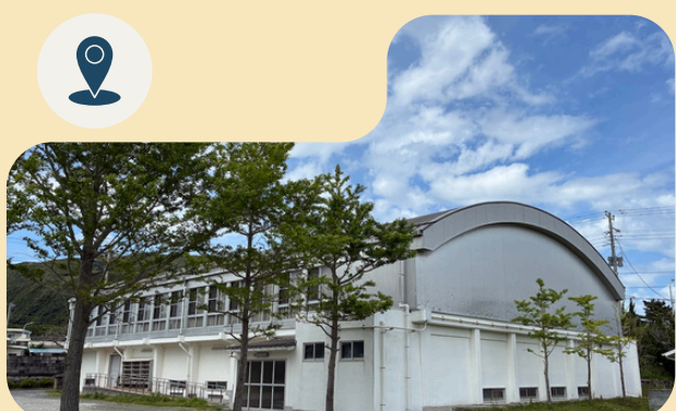
旧新島中学校体育館