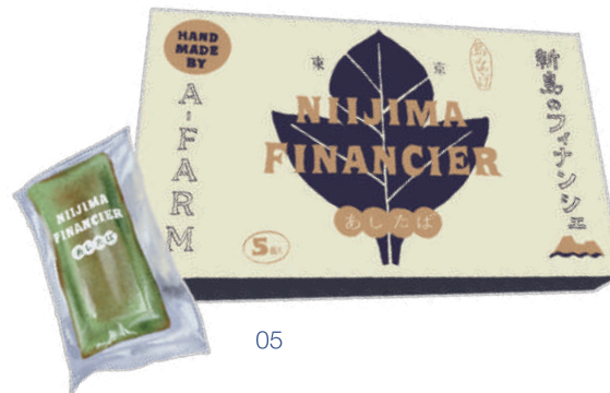
明日葉 フィナンシェ

自家栽培の明日葉と良質な国産バターを生地にたっぷり練り込み、風味豊かに焼き上げた明日葉農家のフィナンシェ。鮮やかなグリーンも目を引きまます。