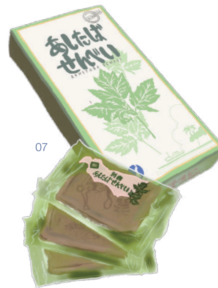
あしたばせんべい

新島で愛され続ける素朴な焼き菓子・牛乳せんべいに、新島産の明日葉ペーストを練り込んで焼き上げました。食品添加物不使用で体に優しいおやつです。