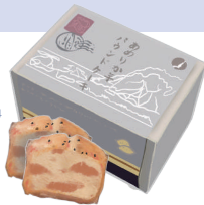
あめりか芋 パウンドケーキ

式根島産の希少なあめりか芋と式根島の焼酎「地錠」を使った熟成パウンドケーキ。あめりか芋、芋ジャム、芋焼酎と、芋が織りなす濃厚な風味と香りは絶品です。