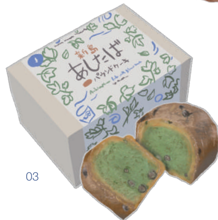
あしたば パウンドケーキ

新島産の明日葉を使って焼き上げた生地に、新島の焼酎「羽伏浦」をしみこませてゆっくりと熟成。まるやかで深い味わいが癖になる、リッチなパウンドケーキです。