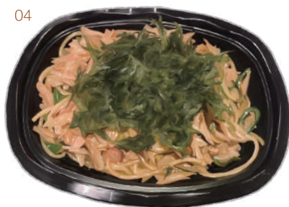
04 くさやスパゲティ

新島産くさやと島のりをたっぷり使い、島唐辛子のピリ辛オイルで味付けした和風ペペロンチーノ。くさやの塩気と旨味が麺にからみ、絶妙なハーモニーを奏でます。