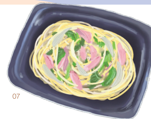
07 明日葉スパゲティ

自家栽培の明日葉や玉ねぎ、にんにく、島唐辛子を使った島野菜たっぷりの一品。野菜の旨味を引き出すシンプルな味付けで、唐辛子の辛みがアクセントに。