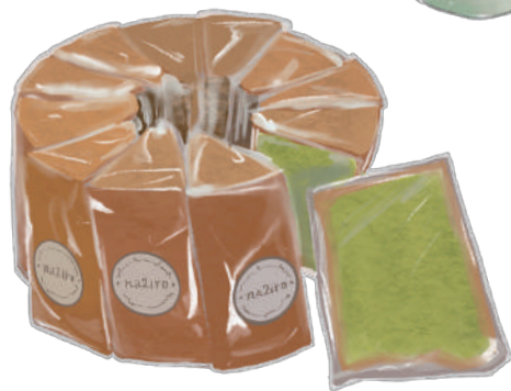
明日葉 シフォンケーキ

栄養価の高い明日葉と鳥ざらめを使った、ふわふわのシフォンケーキ。明日葉特有の苦みを抑え、ベーキングパウダー不使用でお子様も安心して食べられます。