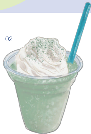
あしたば フラペチーニ

新島産明日葉の香りと風味を活かしながら、さっぱりした後味に仕上げたフローズンドリンク。美容健康効果も高い明日葉パワーで暑い夏も乗り切れそう？