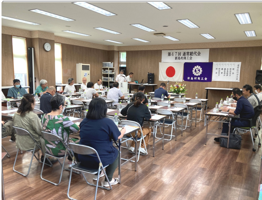
第47回通常総代会 新島村商工会

【第2号議案】令和4年度会館特別事業報告並びに一般会計収支決算書及び令和4年度特産品普及特別会計収支決算書の承認に関する件 (1) 会館特別会計 (2) 特産品普及特別会計 【第3号議案】令和4年度労働保険料徴収・納付状況報告に関する件