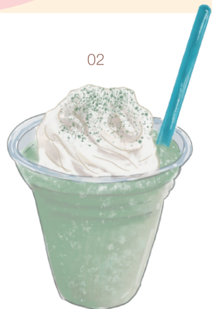
あしたば フラペチーネ

新島産明日葉の香りと風味を活かしながら、さっぱりした後味に仕上げたフローズンドリンク。美容健康効果も高い明日葉パワーで暑い夏も乗り切れそう？