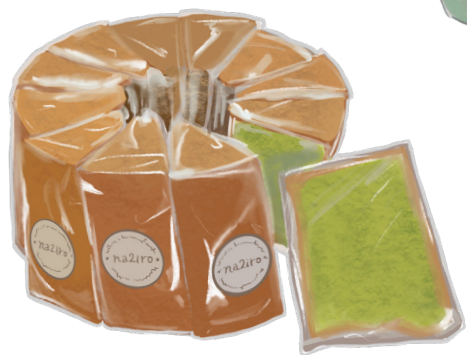
明日葉 シフォンケーキ

栄養価の高い明日葉と島ざらめを使った、ふわふわのシフォンケーキ。明日葉特有の苦みを抑え、ベーキングパウダー不使用でお子様も安心して食べられます。