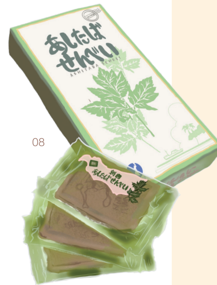
あしたばせんべい

新島で愛され続ける素朴な焼き菓子・牛乳せんべいに、新島産の明日葉ペーストを練り込んで焼き上げました。食品添加物不使用で体に優しいおやつです。