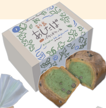
あしたば パウンドケーキ

新島産の明日葉を使って焼き上げた生地に、新島の焼酎「羽伏浦」をしみこませてゆっくりと熟成。まるやかで深い味わいが癖になる、リッチなパウンドケーキです。