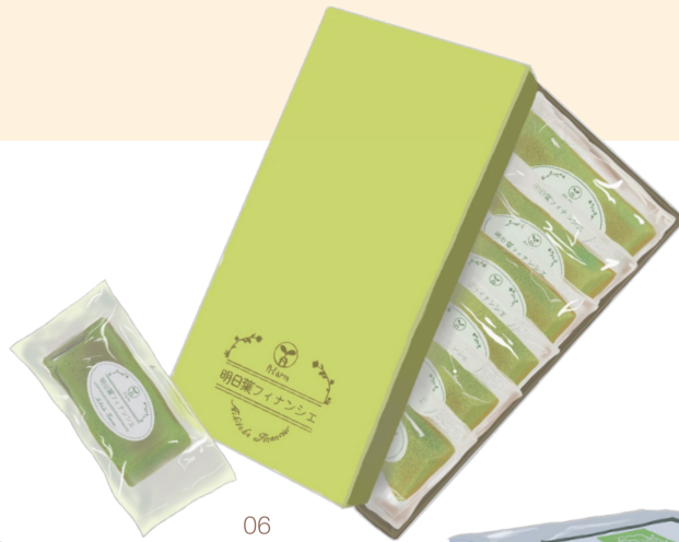
明日葉 フィナンシェ

自家栽培の明日葉と良質な国産バターを生地にたっぷり練り込み、風味豊かに焼き上げた明日葉農家のフィナンシェ。鮮やかなグリーンも目を惹きます。