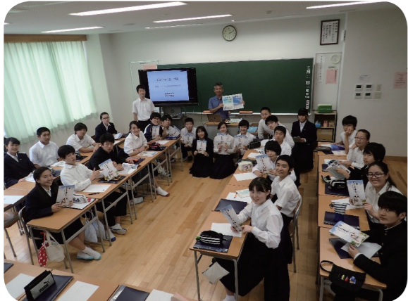
■授業後の教室で記念撮影!