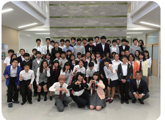
■エキストラにご協力ありがとうございました!

今後とも、ロケを活用した新島村PR事業の一環として、ご理解頂きますよう宜しくお願いいたします。