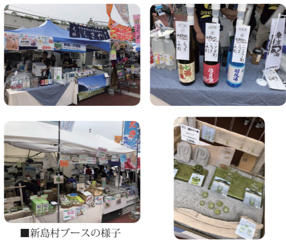
■新島村ブースの様子

商工会では、島ハイサワーの提供の他、新島ガラス、コーガ石製品、牛乳せんべいなどを販売。好天にも恵まれ、前回は上回る来場者、売上となりました。 東京の島に興味を持つ人が来場する島じまは、絶好のPRの場であると同時に、他島と比較される場でもあります。今後このような場を有効に活用し、お客様の反響や他島の取り組みを事業者に還元していきたいと思えます。 今秋から、都内各地の物産展や展示会に出店予定です。